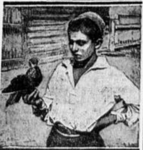
ПЕРНАТЫЙ ДРУГ. (А. Тайшин, г. Чита).