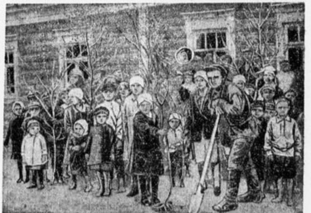
«День леса» в д. Глотаево, Михневск. вол., Серпуховского у.