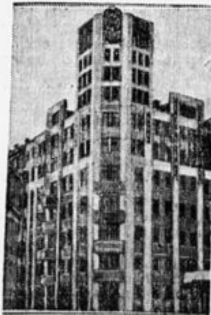
ДОМ МОССЕЛЬПРОМА. (В. Стариков, г. Свердловск).