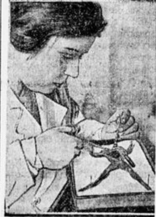
Работник института вынимает сердце у живой лягушки, чтобы заставить его жить на крючке еще десять часов.

И если за три года своего существования в своих клетушках-лабораториях он добился таких больших результатов, то лет через 10—15, к 1940 году, он вырастет в громадное здание с десятками просторных лабораторий, в которых советская наука будет выковывать то самое ценное и дорогое, что только есть у нас в Союзе,—здоровую и радостную трудовую жизнь для миллионов рабочих-пролетариев.