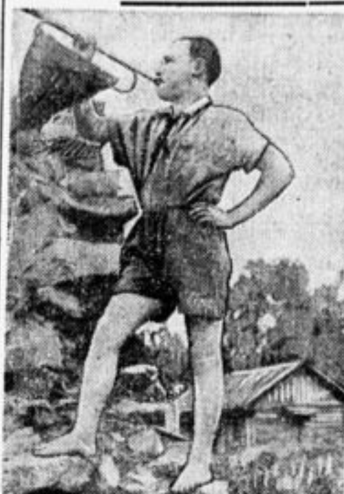
НА ОБЕД. (В. Стариков, Свердловск).