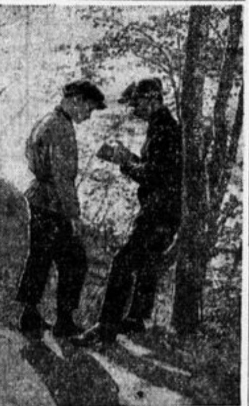
КАКОГО У ТЕБЯ АППАРАТ? (Н. Семиков, Москва).