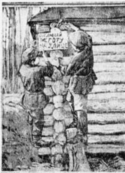
Санитарное звено в дер. Тапканове, Ростовцевкой волости, Каширского у., за работой.